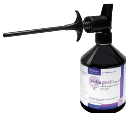
Virbagest 4 mg/ml ALTRENOGEST