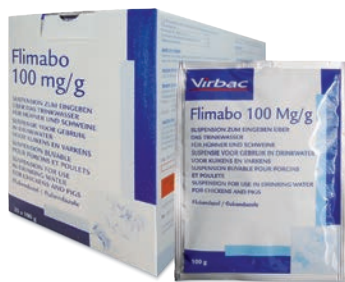
Flimabo 100mg/g FLUBENDAZOL