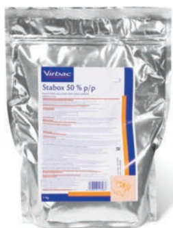
Stabox® 50% P.O.S. Cerdos AMOXICILINA