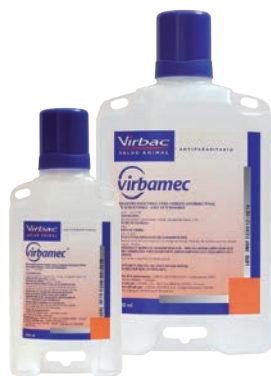
Virbamec® 10mg/ml IVERMECTINA