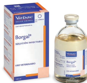
Borgal® SULFADOXINA + TRIMETOPRIMA